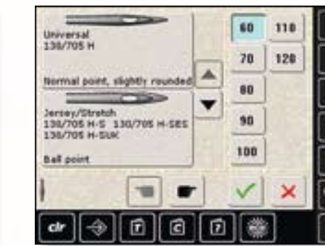
Tabella aghi: L'ago attualmente usato può essere registrato in una tabella speciale della macchina ed è visualizzato ogni volta che la macchina viene accesa. Più tempo per concentrarsi sulla creatività.

Tapering: Esprimete la vostra creatività con nuove tecniche. Nel Tapering l'inizio e la fine dei motivi ad angolo sagomato formano una punta con angolazioni programmabili. Per ancora più creatività.